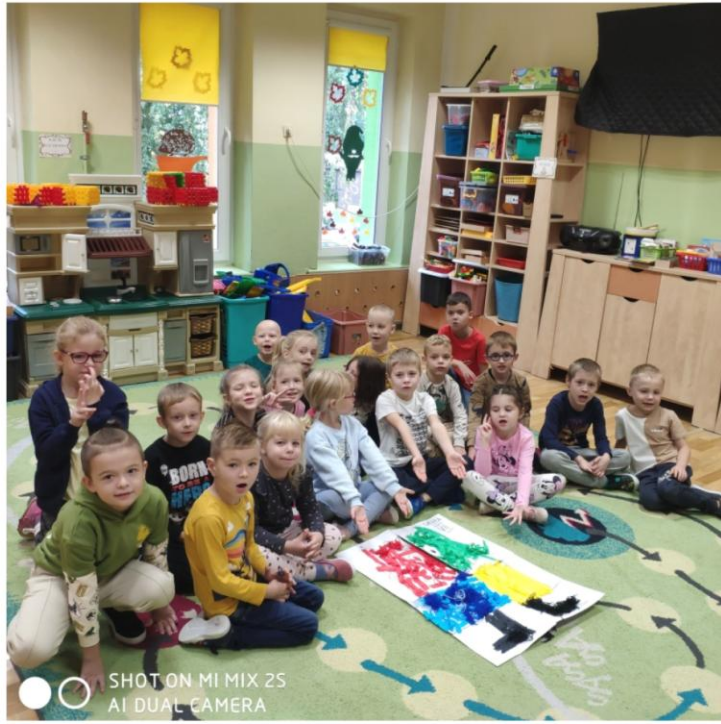
SHOT ON MI MIX 2S AI DUAL CAMERA