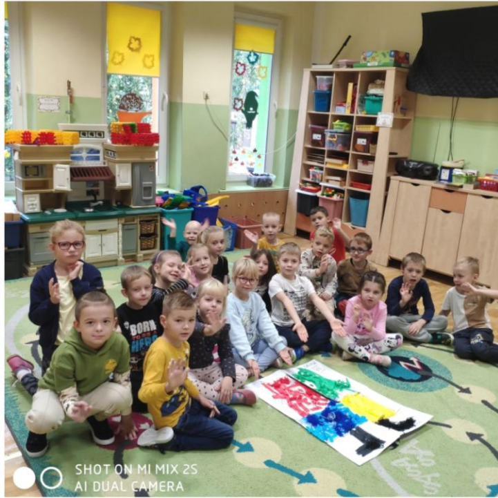
SHOT ON MI MIX 2S AI DUAL CAMERA