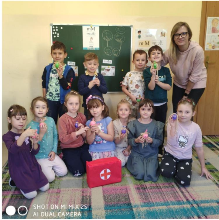
SHOT ON MI MIX 2S AI DUAL CAMERA