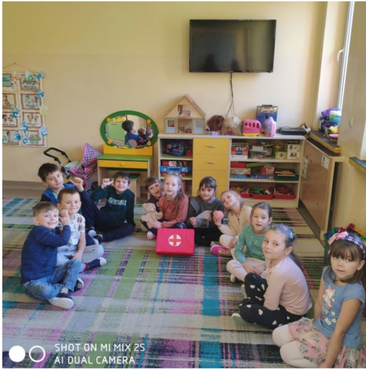
SHOT ON MI MIX 2S AI DUAL CAMERA