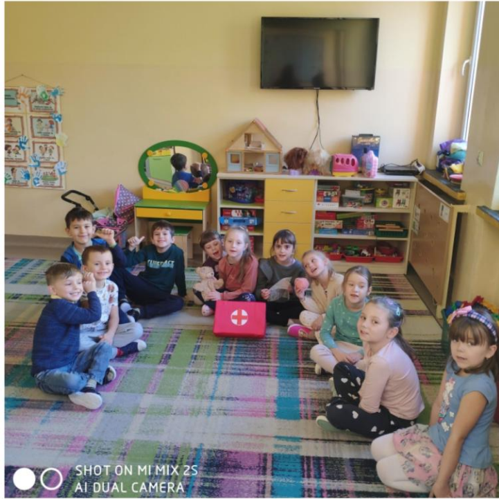
SHOT ON MI MIX 2S AI DUAL CAMERA