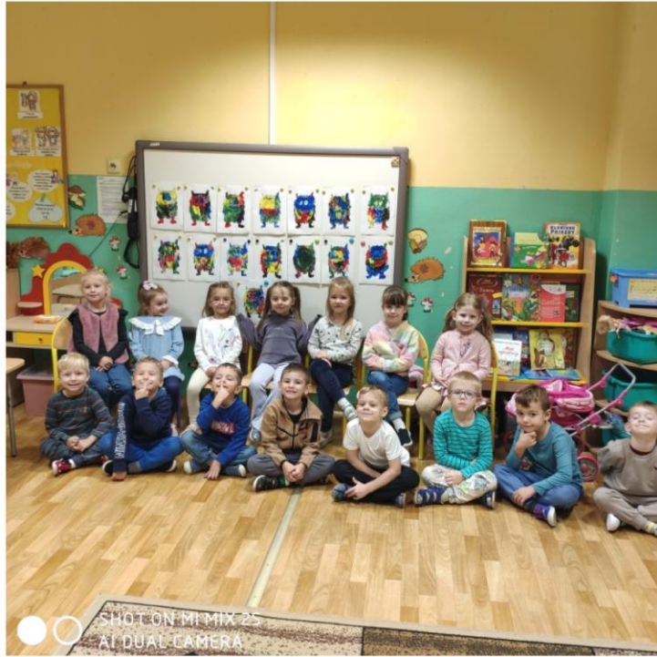
SHOT ON MI MIX 2S AI DUAL CAMERA