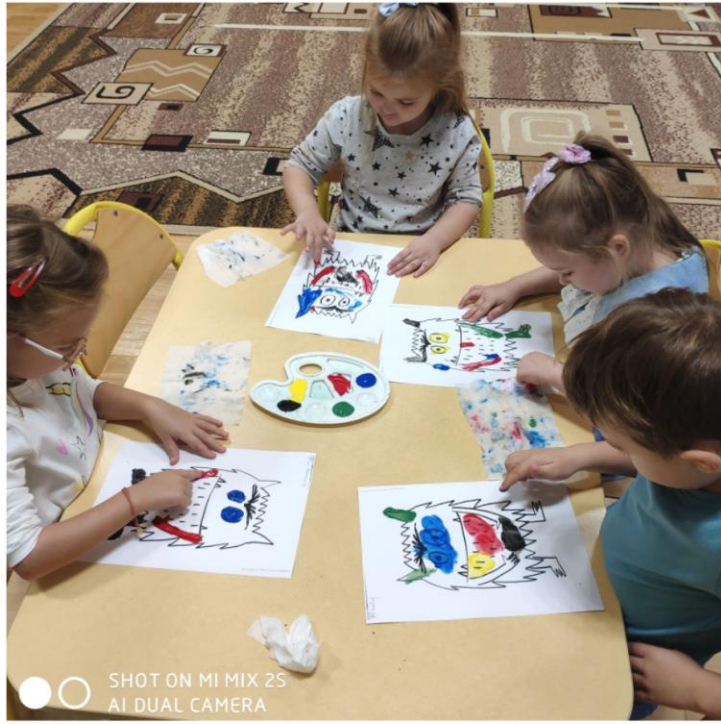
SHOT ON MI MIX 2S AI DUAL CAMERA