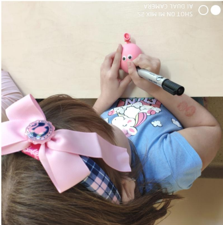
SHOT ON MI MIX 2S AI DUAL CAMERA